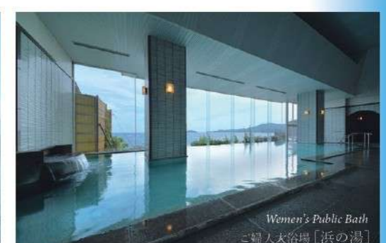
Women's Public Bath 「浜の湯」 女大浴場