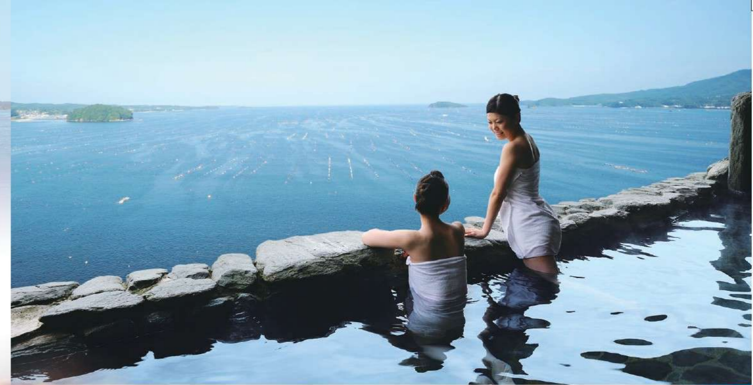
Women's Open Air Bath 「かもめ遊」 女大露天風呂