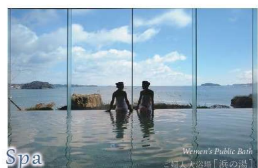
Women's Public Bath 「浜の湯」 女大浴場