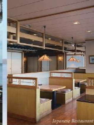
Japanese Restaurant 和食処「潮騒」