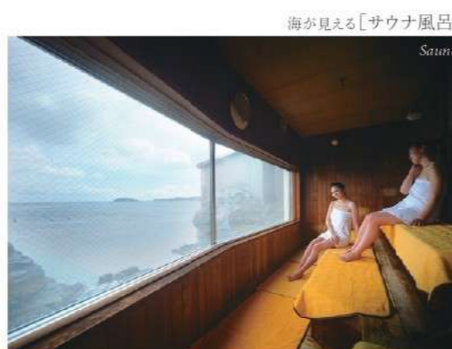
海が見える「サウナ風呂」 Sauna