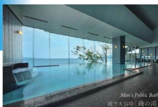
Men's Public Bath 「戦の湯」 女大浴場