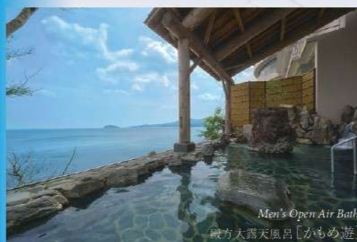
Men's Open Air Bath 「かもめ遊」 女大露天風呂

水平線まで見渡す志津川湾の海と 南三陸温泉の露天風呂が一体となった心地よい浮遊感 至福の時間でココロまで温まるインフィニティ温泉