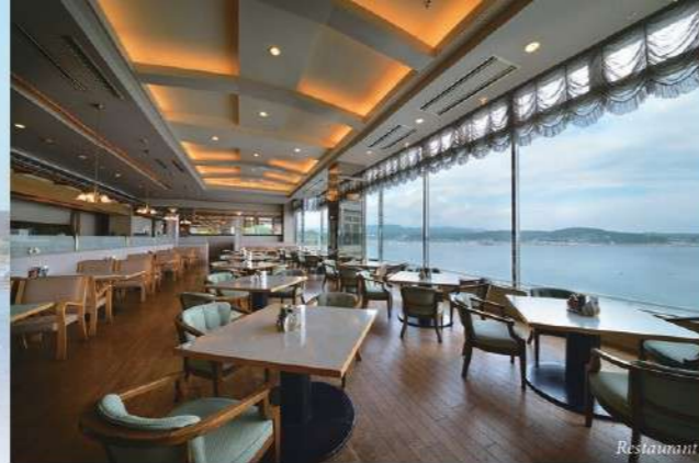
レストラン「シーサイド」