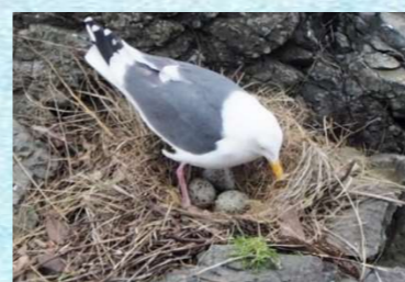
2023年5月、3個の卵を発見!

今年も5年連続でオオセグロカモメの卵を発見! 場所は今回も同じホテル真下の岩場でございます。3個の卵を発見し、無事に全てが孵化! 海くん、遊ちゃん、虹ちゃんと名づけました! ヒナたちは日々すくすく成長しています♪ 無事に巣立つことを祈りつつ、温かく見守っていきたいと思います。