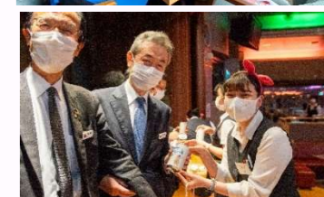
様々な場面で活躍していただきました