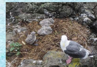
元気な3羽のヒナたちはスタッフやお客様からも大人気!