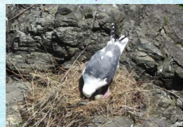
2023年6月、お母さんがクチバシで触れ始めました。孵化の兆しです!