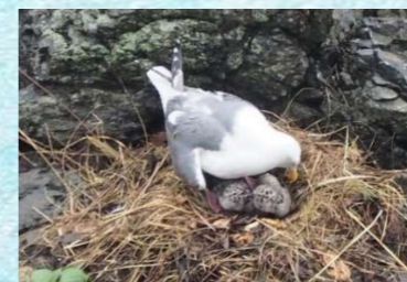
2023年6月中旬、無事に全て孵化しました! とってもかわいい~!