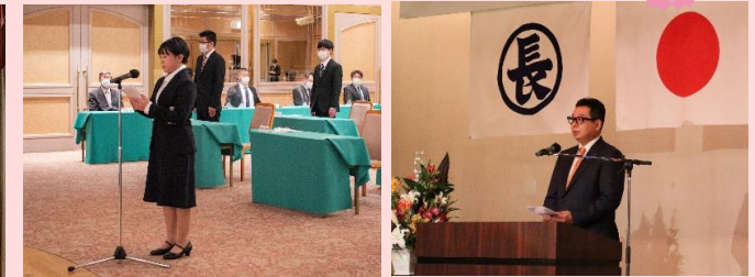
新入社員代表謝辞