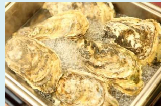
カキのカンカン蒸し 6ヶ入り 2,750円(税込)