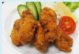
カキフライ 880円(税込)