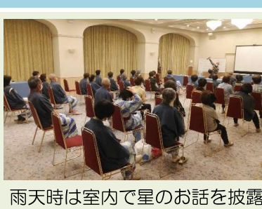
雨天時は室内で星のお話を披露