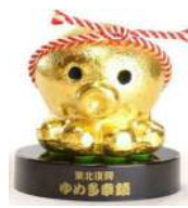
オクトパス君金ダコ