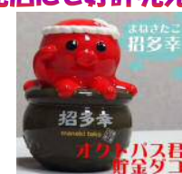
オクトパス君貯金ダコ