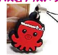
ラバーストラップ