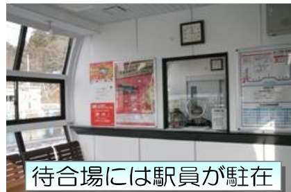
待合場には駅員が駐在

BRTは一時間に一本、通勤・通学時間帯は2本以上あり、より一層使いやすく、便利になりました。当館からは最寄り駅まで送迎もありますので是非ご利用下さい♪