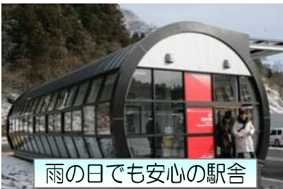
雨の日でも安心の駅舎