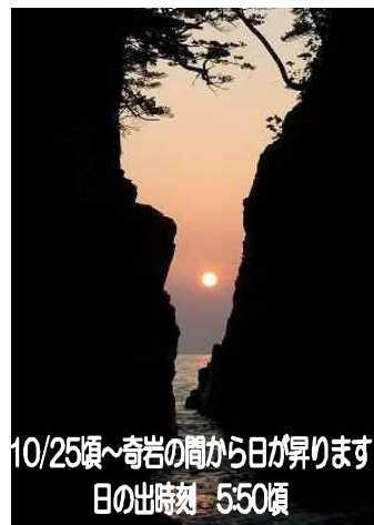
10/25頃～奇岩の間から日が昇ります 日の出時刻 5:50頃