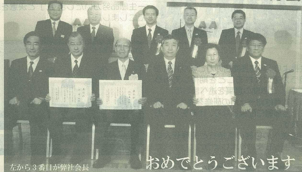
左から3番目が弊社会長