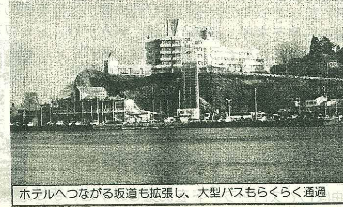
ホテルへつながる坂道も拡張し、大型バスもらくらく通過