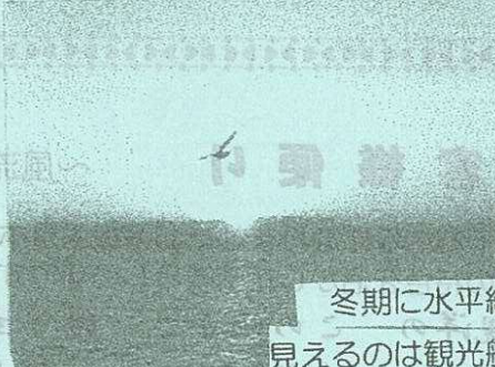
冬期に水平線より日の出が見えるのは観光船だけ

謹んで初春のお慶びを申し上げます。 南三陸ホテル観洋はおかげさまで今年で三十五周年を迎える事が出来ました。 これもひとえに皆様のご愛顧とご指導の賜物と深く感謝を申し上げます。 昨年は新源泉を掘削し、十二月二十六日より二本目の天然温泉を開湯致しました。地下二千メートルより汲み上げる温泉は一本目の成分にカルシウムが加わり、全体の成分濃度も三倍程ある良質の温泉でございます。是非お試し下さいませ。 また、新しく気仙沼プラザホテルが阿部長商店グループに加わりました。現在改装を行っており、春には新しく生まれ変わった施設でお楽しみいただけますよう取り組んでおります。 開湯一年を迎え、大好評をいただいております。ササンマリン気仙沼ホテル観洋と共に三ホテルをお引き立て賜りますようお願い申し上げます。 年度内には三陸自動車道の「桃生・C」が開通し、より短時間で御越しいただけます。 より身近となりますので御宿泊や日帰りでお気軽にお越し下さいませ。 本年は三十五周年の記念の企画を行い、盛り上がるよう取り組んで参ります。 「海の館」ホテル観洋として、志津川湾の絶景や三陸産の海の幸をお楽しみいただき、寛ぎのひとときをお過ごしただけですようサービス向上を図りたいと考えておりますので本年も皆様のご支援・ご指導の程、宜しくお願ひ申し上げます。