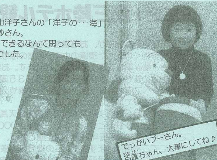
でっかいブーさん。器華ちゃん、大事にしてね♪

カラオケ大会終了後にはお楽しみ抽選会。皆さん何が当たったかな？ 次の大会でまたお会いしましょう♪