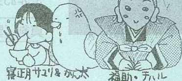
寝正月サリとみ太 福助・チル

〒986-0766 宮城県本吉郡南三陸町志津川字黒崎 99-17 南三陸ホテル観洋 情報誌編集部 E-mail: minamisanriku@kanyo.co.jp FAX: 0226-46-6200