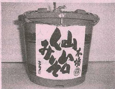
800g 1050円（売店にて好評発売中）

仙台味噌の歴史は古く、伊達政宗が城内で軍遠征用に醸造を始めたという記録が残っています。 おいしくて体に優しい仙台味噌、是非一度ご賞味下さい！