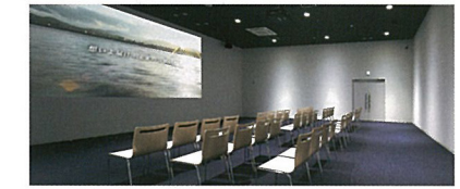
気仙沼復興シアター 復興の歩みをショートムービーとしてご紹介。海と共に生きてきた皆さんが語る「未来の水産都市・気仙沼に対する願い」にぜひ耳を傾けてください。