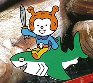
気仙沼市観光キャラクター「海の子・ホヤぼーや」