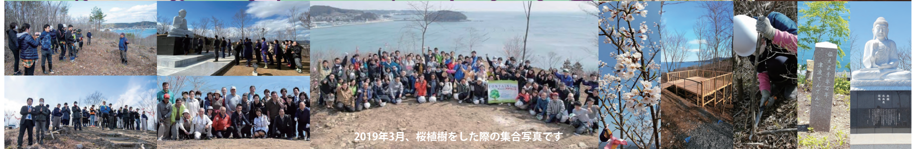
2019年3月、桜植樹をした際の集合写真です