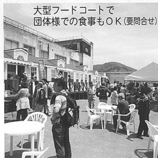
大型フードコートで 団体様での食事OK(要問合せ)