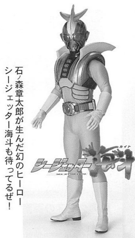
石ノ森章太郎が生んだ幻のヒーロー！ シーエッター海斗も待ってるぜ！