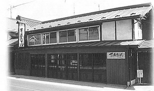
石ノ森章太郎生家

■休館日 毎週月曜日(祝祭日の場合は翌平日) 年末年始(12/29～1/3) (臨時開館の場合有り)