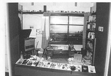
トキワ荘の再現室内