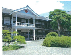
③登米/みやぎの明治村