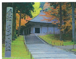
①平泉/世界遺産中尊寺