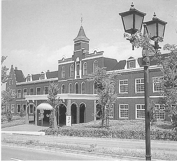
伊達の牛たん 宮城インター店 (仙台ヒルサイドアウトレット内) ■客席 500席

広々と開放的な雰囲気が好評の 伊達の牛たん のレストラン、 観光エリアごとにご利用しやすい3つの店舗は合計850名様を収容できます。 お食事に、お土産のお買い物に、3つの店舗をどうぞ、ご利用下さいませ。