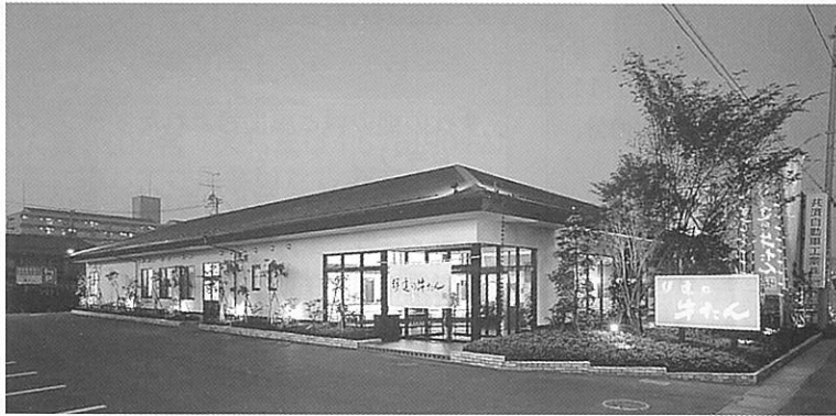
伊達の牛たん 東インター店 ■客席 200席