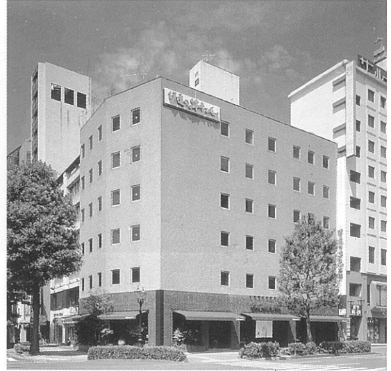
伊達の牛たん 本店(仙台駅前) ■客席 150席