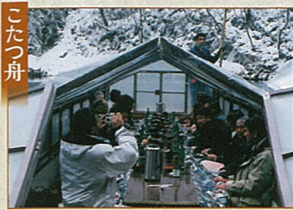
こたつ舟 12月～2月限定。こたつで温もり鍋や釜飯に舌鼓、雪景色を満喫!