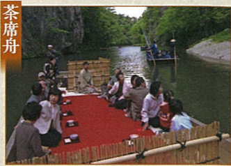
茶席舟 新緑シーズン限定の雅な舟上茶会を楽しめます。