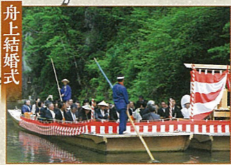
舟上結婚式 古式ゆかしい和の結婚式を、東日本きっての名勝で。(要問合せ)