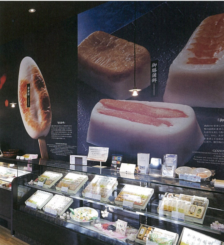
▼「シーバルピア女川店」店内