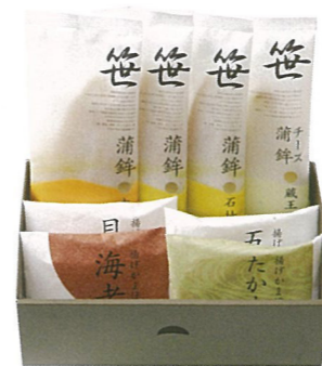
● 「金華-1」……1,080円 笹かまぼこ 吉次×1・石持×2・チーズ笹かまぼこ蔵王×1、揚げかまぼこ×4

万石工場に隣接した本店ならではのオリジナル詰合わせは3種類。 旅の思い出や贈り物にもお喜びいただけます。