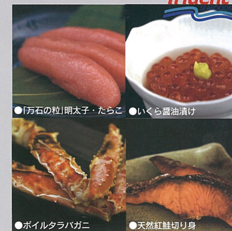
● 「万石の粒」明太子・たらこ ● いくら醤油漬

アメリカ大手水産業の「トライデント社」の商品。タラコや鮭、イクラやタラハ蟹など、その優れた品質は多くの皆様にご好評をいただいている商品です。 Trident