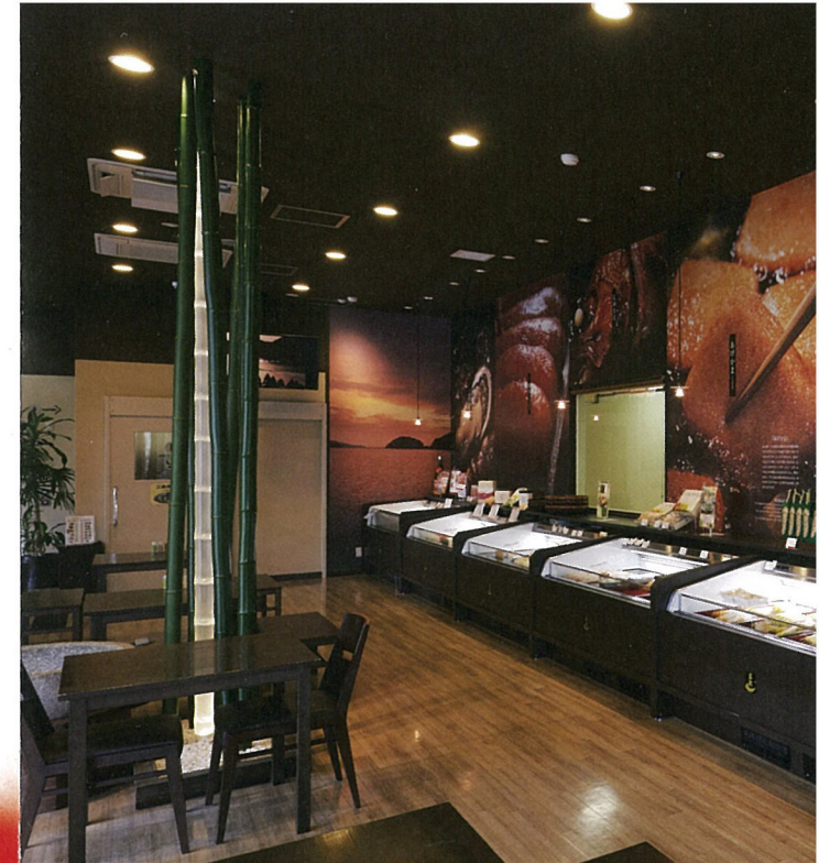
▲本店「万石の里」店内