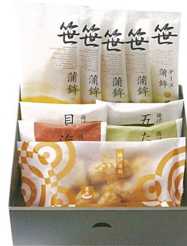
● 「金華-2」……1,575円 笹かまぼこ 吉次×2・石持×2・チーズ笹かまぼこ蔵王×1、揚げかまぼこ×4・ぶちあげ×1