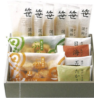
● 「金華-3」……2,100円 笹かまぼこ 吉次×2・石持×2・チーズ笹かまぼこ蔵王×2、揚げかまぼこ×4・ぶちあげ×2