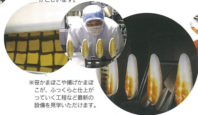
※笹かまほこや揚げかまほこが、ふっくらと仕上がっていく工程など最新の設備を見学いただけます。

本店ならではの楽しいコーナーです。ご来店後係員にお申し出下さい。スタッフの説明のもと楽しく安全に笹かまこの手焼き体験をお楽しみいただきながら、その場でお召上がりいただけます。