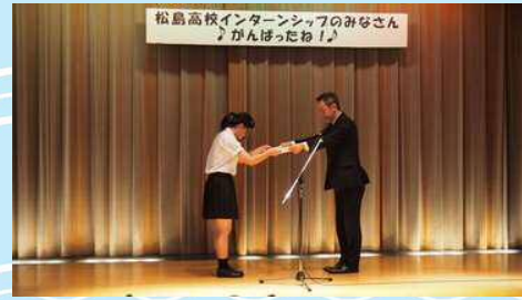
がんばった皆さん一人一人に副社長より修了証が授与されました

1ヶ月間本当にありがとうございました！一緒にお仕事できて本当に良かったです。また機会がありましたら、ぜひホテルへ遊びに来て下さいね♪