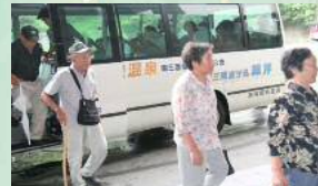
観洋ぐるりんバス

この度、当館が震災直後に行っていた仮設住宅を無料で巡る『観洋ぐるりんバス』と、現在も継続して行っている『学習支援』の取り組みが【楽天トラベル賞】を受賞致しました。地域住民のコミュニティ作りや、子ども達への学習支援、被災者支援の一環としての事業サポートや、館内でのワークショップの開催が評価されました。地域に根差す宿として、今回の受賞は大変嬉しく存じます。今後も地域住民の皆様と歩む宿として、町民のコミュニティ環境の確保や、子どもたちの学習支援を継続して行っていく所存でございます。