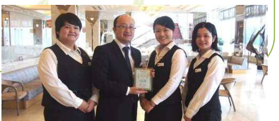
ネット販売課メンバー