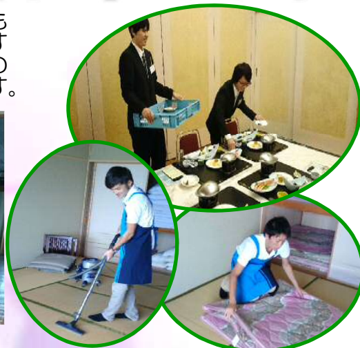
↑ 明海大学生の活動の様子