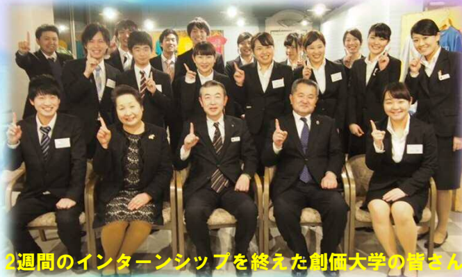
2週間のインターンシップを終えた創価大学の皆さん

皆さんには、お部屋掃除や宴会場での料理付け、お客様へのお料理出しなどを体験しながら、ホテルのおもてなし、被災地の現状等を学んで頂きます。3日間から1ヶ月程の期間ではございますが、初日に比べ皆さん大変大きく成長されております。