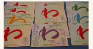
『輪』で繋がるメッセージもたくさん集まりました！

【イベント名称の『わ』に込められた意味には、支援活動の「輪」のほかに、被災者と支援者で手を取り合う「輪」、将来への希望や思いをつなぐ「輪」、一丸となって復興に取り組む調和の「和」、元気な日本の「和」があります。】