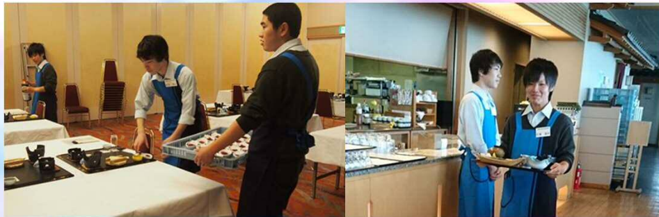
↑ 志津川高校ジュニアインターンシップの様子

当館では、修学旅行だけでなく、学生さんのインターンシップも積極的に受け入れをしております。震災前から継続しております志津川高校のジュニアインターンシップを始め、震災後は長期の休みを利用した大学生のインターンシップも受け入れております。