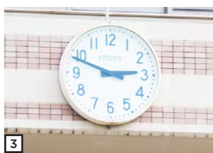
1 復旧・復興に向けた工事が続く南三陸町。献花台には今も花が絶えない 2 震災遺構「高野会館」。津波は4階近くにまで達した 3 あの日のましまる元戸倉中学校の時計