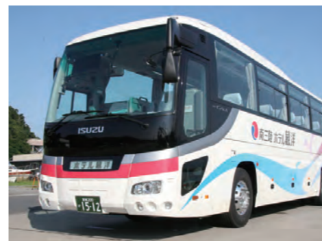
語り部バスは希望者が一人でもいれば運行される

次に、南三陸町を守る、そのけん引役にならなければいけないと考えました。宿泊産業は経済効果の裾野の広い業種で、