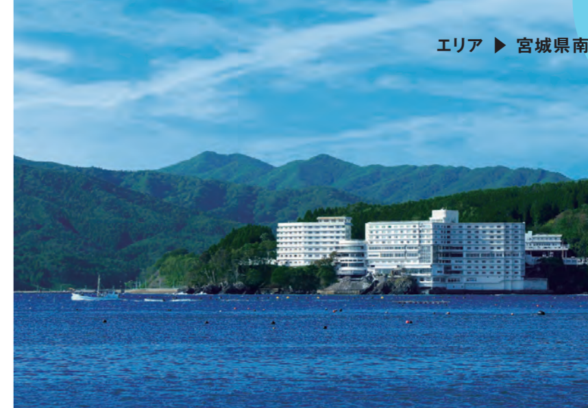
高台の岩盤の上に立つ南三陸ホテル観洋。目の前には志津川湾が広がる