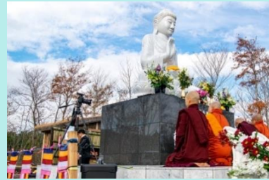
<ミャンマー式開眼法要>

開眼法要の運びとなりました。 儀式はミャンマー式と日本式の両方が執り行われ 大仏様は【南三陸大仏】と名付けられました。 地域住民の安寧を願い、また、この町の新しいシンボルに なってほしいという願いで建立されたものです。