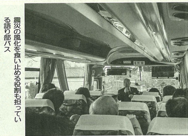
震災の風化を食い止める役割も担っている語り部バス

復興庁は、東日本大震災後の新しい東北の創造に向けた取り組み顕彰する「新しい東北」復興・創生顕彰を実施しているが、2018年度より10社を選定した。観光関連では南三陸ホテル観洋(宮城県南三陸町)の語り部バスの取り組みが高く評価され、受賞した。