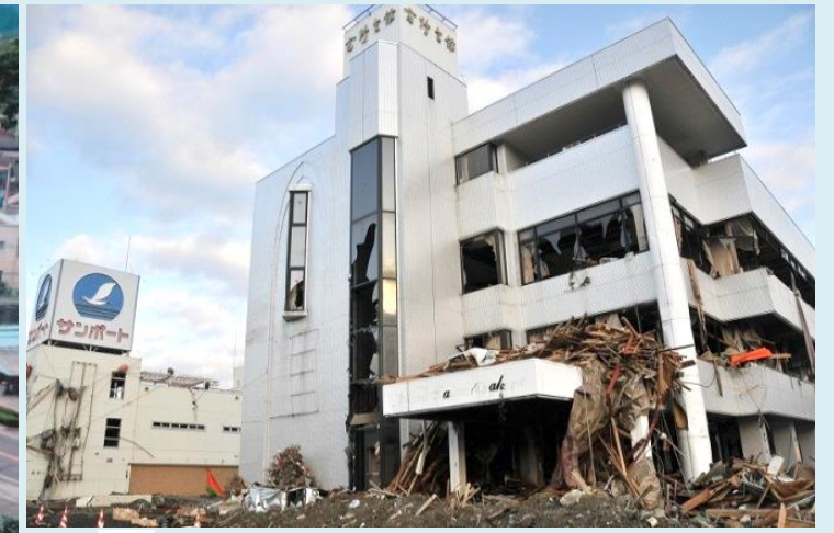
民間震災遺構「高野会館」