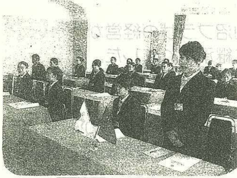
開講式にて 自己紹介

21世紀は新しいリゾートの時代 阿部長商店は人々が心身共にくつろげる真のリゾート開発事業を地域開発に貢献しながら、自然の恩恵あふれるこの地で進めております。今回は阿部長商店の観光関連施設をご紹介致します。