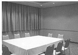
小ホール [はまゆり]

ブライダル・ご会食・各種パーティー 会議・研修会・各種ミーティング 団体昼食等にご利用下さいませ。