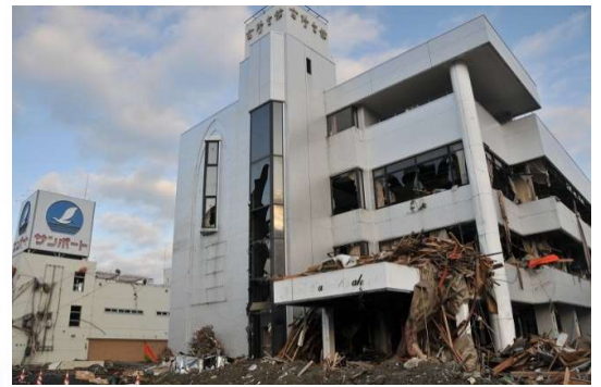
地震過後的高野會館

宮城縣南三陸町の綜合婚宴館「高野會館」建於1986年(昭和61年)，坐落於距離志津川灣約300公尺處的平地上，為當地的臨時避難所之一。在東日本大地震當天，正好在舉行年長者居民們的才藝發表大會，多虧了現場人員果決的行動，高野會館也成為拯救327位居民和2隻狗的救命之地。高野會館的員工打從平日便相當注重各種對應措施以及防災意識，藉由定期舉行避難演習，以及儲備各樓層緊急時所需之物資，才得以在當時立下大功，此舉也顯現出緊急時刻所應表現出的判斷和行動。